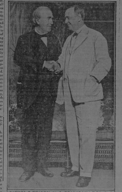
THOMAS A. EDISON AND SECRETARY DANIELS

INVENTIVE GENIUS PLANNING TO MAKE THIS COUNTRY IMPREGNABLE